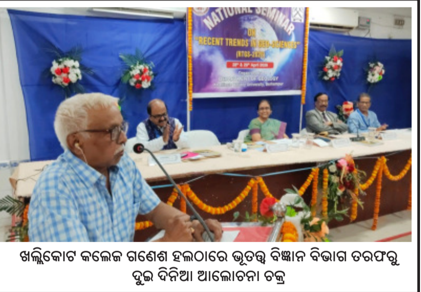
ଖଲ୍ଲିକୋଟ କଲେଜ ଗଣେଶ ହଲଠାରେ ଭୃତୁଷ୍ଟ ବିଜ୍ଞାନ ବିଭାଗ ତରଫରୁ ଦୁଇ ଦିନିଆଁ ଆଲୋଚନା ଚଳୁ