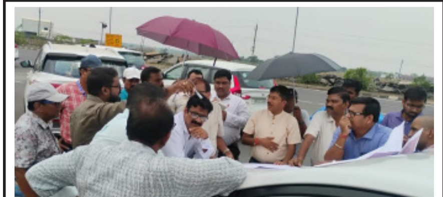
ବ୍ରହ୍ମପୁର: ହଳଦିଆପଦର ରେଲଫ୍ରେ ଓଭର ବ୍ରିଜ ନିକଟରେ ଜାତୀୟ ରାଜପଥ ଓ ପୂର୍ବ ବିଭାଗ ସହ ରେଲ ବିଭାଗର ଯନ୍ତ୍ରୀମାନଙ୍କ ମିଳିତ ଭାବେ ଆଲୋଚନା ।