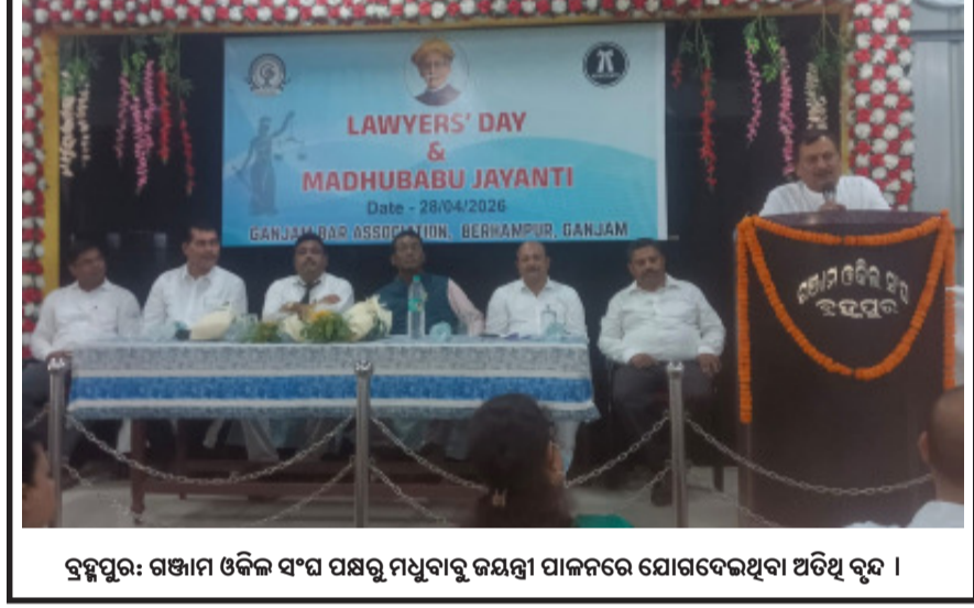
ବ୍ରହ୍ମପୁର: ଗଞ୍ଜାମ ଓକିଲ ସଂଘ ପକ୍ଷରୁ ମଧୁବାବୁ ଜୟନ୍ତୀ ପାଳନରେ ଯୋଗଦେଇଥିବା ଅତିଥି ଦ୍ୱୟ ।